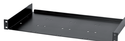
PA-T 1U Rackwanne